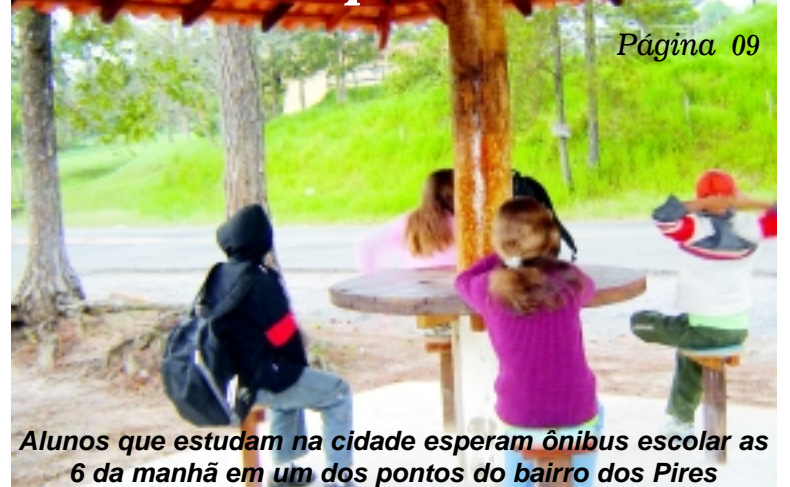
Alunos que estudam na cidade esperam ônibus escolar às 6 da manhã em um dos pontos do bairro dos Pires